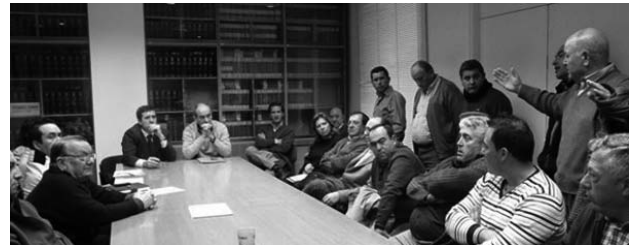
Reunión mantenida en la delegación de Agricultura y Medio Ambiente.

ASAJA ha insistido en que los agricultores no pueden afrontar, de ningún modo, las pérdidas que los conejos producen en sus explotaciones y que ni tan si quiera la cobertura del seguro para los daños de fauna silvestre es suficiente para paliar, por lo que recuerda que si no se ataja este problema, los propietarios serán los responsables de los daños y deberán asumir las consecuencias.