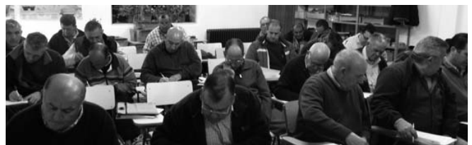
Curso realizado en Honrubia recientemente.

que se irán cerrando en los próximos días. La formación que necesitas, en tu Organización. ●