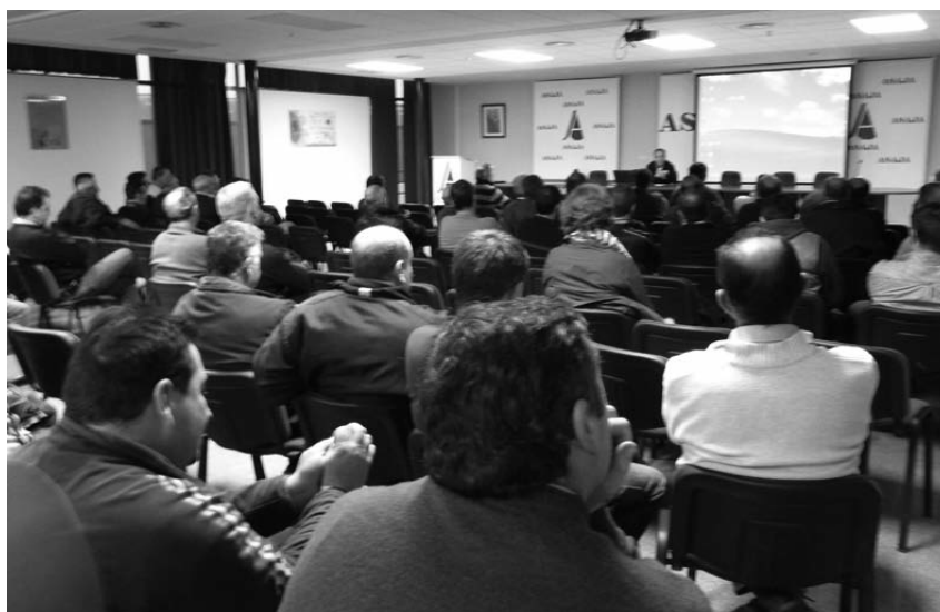
Asamblea celebrada en la sede de ASAJA de Cuenca el pasado 17 de febrero de 2011.

Ante el éxito de la pasada campaña, los profesionales del departamento han decidido adelantar la planificación de la campaña para poder ofrecer a los interesados las mejores semillas, del calibre deseado y de calidad contrastada a los precios más competitivos. ●