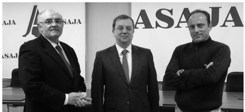
El Consejero de Ordenación del Territorio y Vivienda, junto al Presidente y al Secretario General de la Organización en el salón de actos de la sede de ASAJA en Cuenca.