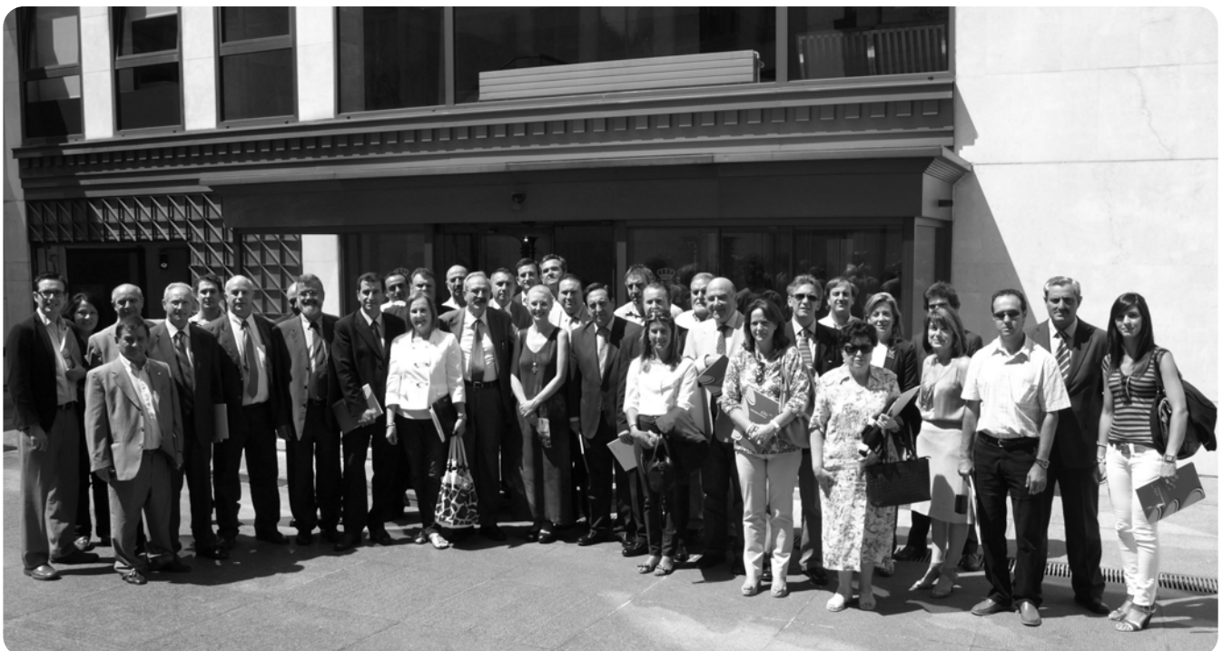
La delegación de ASAJA Nacional en Bruselas